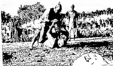
FIG. 4 Vajramusti Wrestling: Middle stage